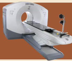
■PET-CTによる画像症例(肺がん)

がん細胞は正常細胞よりも3~8倍のブドウ糖を消費する点に着目し、疑似ブドウ糖にポジロン(陽電子)を放つ物質を組み込んだ薬剤を注射、がん病巣に集積する様子を画像化します。「細胞の代謝や血流から悪性度等、機能情報を画像化できるPET(陽電子放射断層撮影)」「病変部の体内での位置が正確にわかるCT」を組み合わせた画像診断装置です。これにより、全身を短時間の診断で小さながんの発見や腫瘍の良性・悪性の判断が可能となりました。